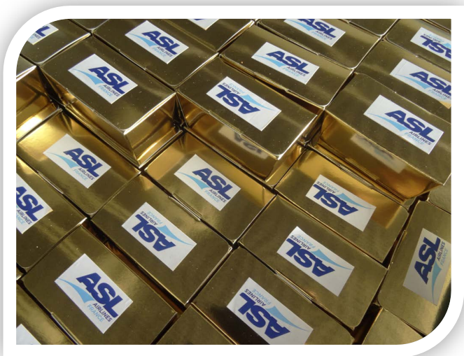
Distribution de ballotins de chocolat aux passagers